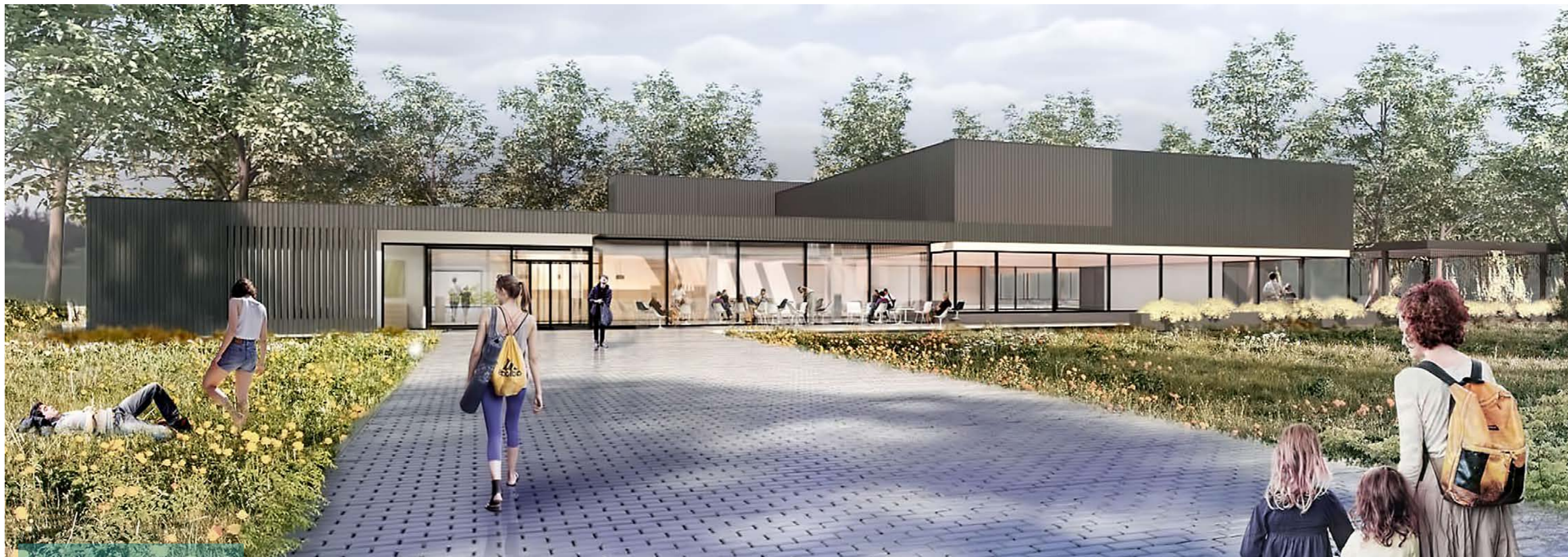
De antracietkleurige gevel bestaat uit verticale beplating die op sommige plekken wordt geaccentueerd met designplaat.